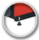
Stopki do regulacji poziomu kotła