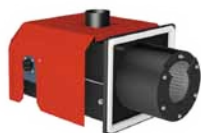
Automatyczny palnik na pelet Fireblast