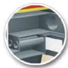
Płomieniówkowy wymiennik ciepła