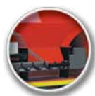
Zbiornik paliwa umieszczony nad wymiennikiem